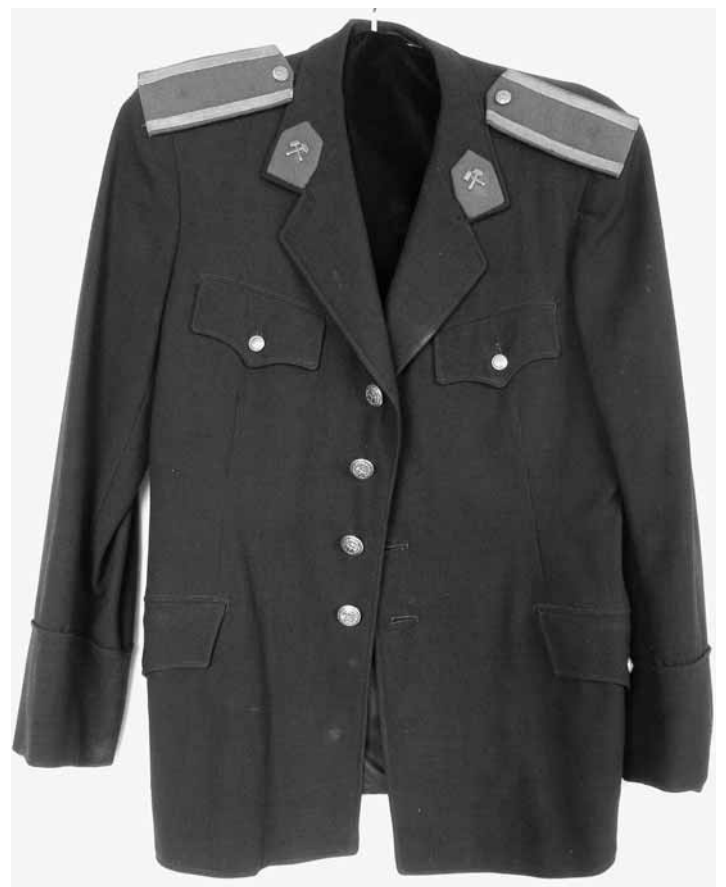
foto: Sako z baníckej uniformy podľa reformy z roku 1953

Toto obdobie je špecifické tým, že sa sociálny status baníkov začal prudko dvíhať. Ako je známe, štát si v období socializmu zvolil za svoju výkladnú skriňu robotníctvo, osobitne banské robotníctvo a snažil sa ho preferovať. Zisťovala som prečo to tak bolo, ako to baníci vnímali a či sa skutočne cítili zvýhodňovaní. Dôvodom takéhoto postupu zo strany štátu bola snaha pozdvihnúť a naštartovať ekonomiku. Na to bola potrebná energia pochádzajúca z uhlia. Preto uhoľní baníci boli na prvom mieste a bolo potrebné radikálne zvýšiť počty zamestnancov v tomto segmente hospodárstva. Výhody, ktoré sa prisúdili uhoľ-