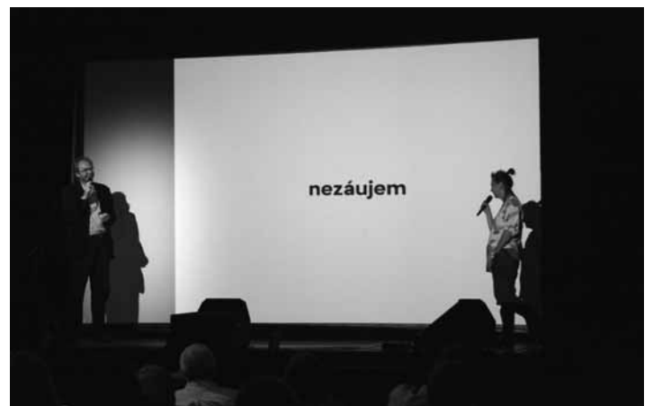
foto: Prezentácia v Divadle Potôň, zdroj: Oddelenie kultúry MsÚ BŠ