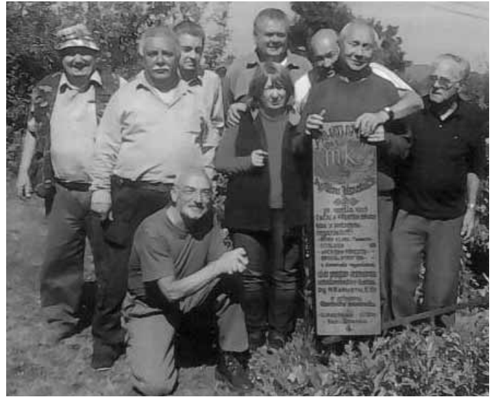
Členovia ZO SZOPK Sitno B. Štiavnica

Veľmi nám pomohla dotácia od Mestského úradu Banská Štiavnica. Naša organizácia podpísala v decembri 2014 s MsÚ Banská Štiav-