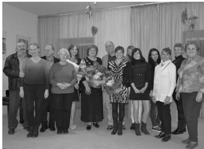
Hostia literárno-hudobného večera