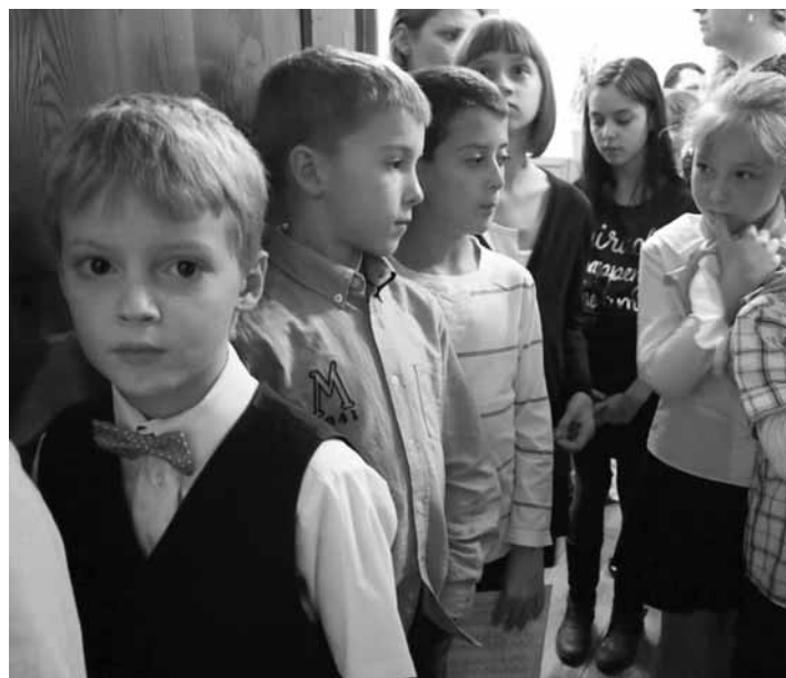
Žiaci ZUŠ vystúpili pre seniorov