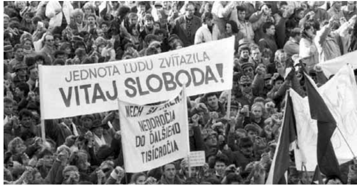
Novembrová atmosféra

Deň 17. november roku 1989 je v kalendári historických udalostí zaznamenaný ako začiatok nežnej revolúcie v Československu. Bol to začiatok demokracie a pád komunistického režimu. 17. november 1989 – Medzinárodný deň študentstva a deň uctenia pamiatky smrti Jana Palacha, ktorý sa pred dvadsiatimi rokmi na protest sovietskej okupácie upálil, sa rovnako ako po iné roky konala manifestácia, organizovaná Socialistickým zväzom mládeže. Udalosti zo 17. novembra 1989, keď sa študentskými demonštráciami začala „Nežná revolúcia“, predchádzali nelegálne stretnutia študentov v Prahe aj v Bratislave. Po-