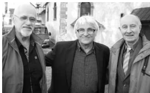
Bývalí spolužiaci z SVŠ-ky

Nie preto, aby sme si ukazovali fotky vnúcat, ale preto, aby sme pospomínali na naše šibalstvá, výlety, brigády a starosti, ktoré sme spôsobili našim pánom profesorom. Bolo to veselé stretnutie po dlhých rokoch. Ďakujem všetkým spolužiakom, ktorých sa mi podarilo zohnať, da-