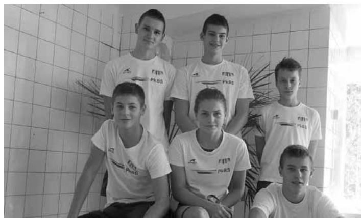
Plavci z PK BŠ