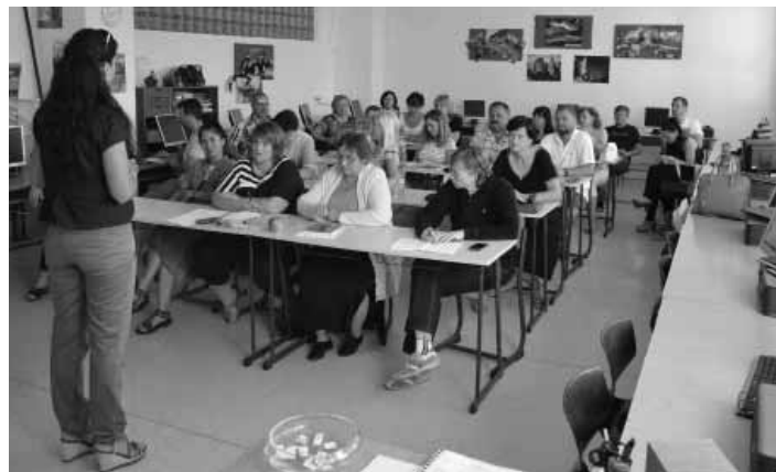
Pedagógovia na školení FOTO SOŠ SAL

Cieľom týchto aktivít bolo získanie a zdokonalenie profesijných kompetencií v oblasti osobnostného rozvoja pedagogických zamestnan-