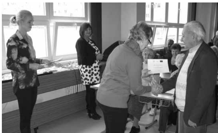
Odvzdávanie certifikátov seniorom

V Materskej škole na ulici 1. mája č. 4 prebiehal v termíne: 14.09.2015 – 27.10.2015 kurz Počítačové zručnosti – Základy práce s PC, školiteľ: Mgr. Jozef Siska a v termíne: 21.09.2015