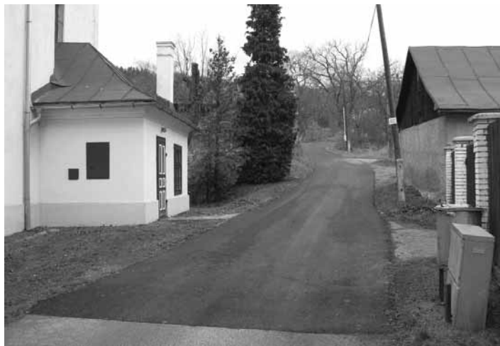
Asfaltový koberec na Štefultove