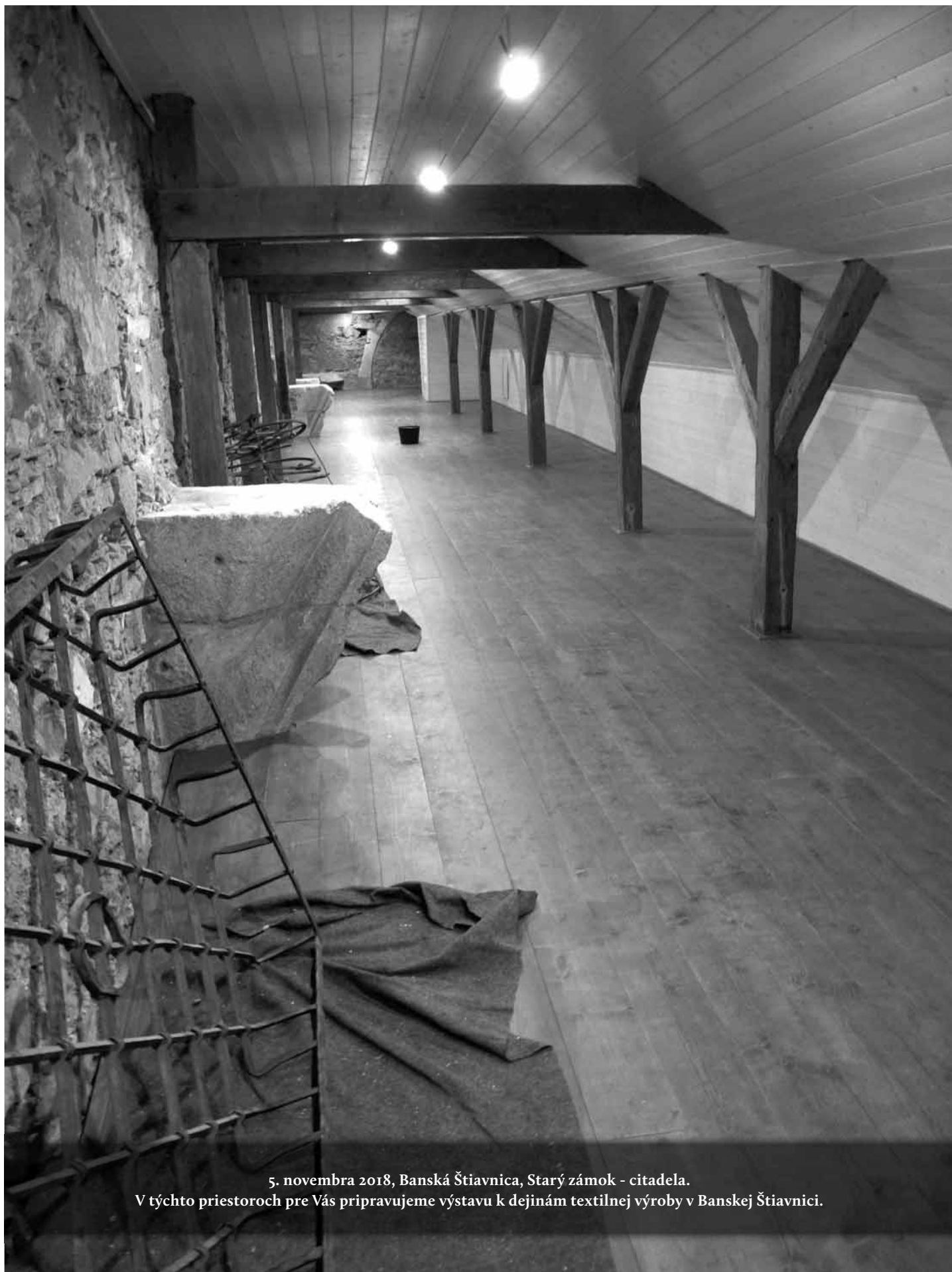
5. novembra 2018, Banská Štiavnica, Starý zámok - citadela. V týchto priestoroch pre Vás pripravujeme výstavu k dejinám textilnej výroby v Banskej Štiavnici.