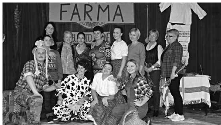
"Farmári" na školskom internáte