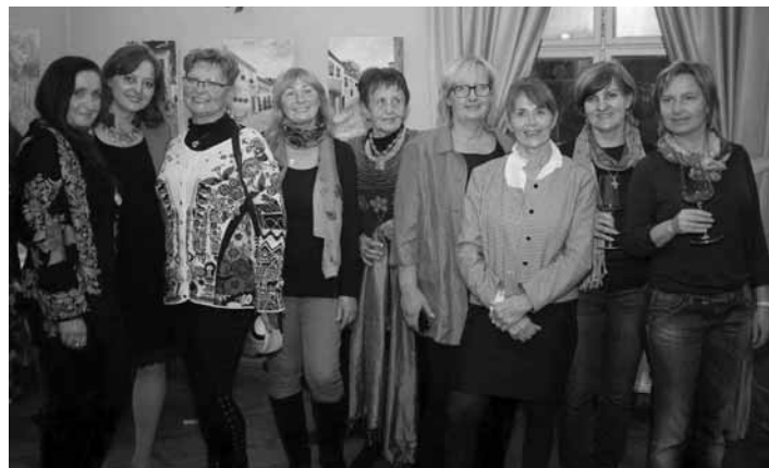
Vernisáž diel neprofesionálnych umelcov