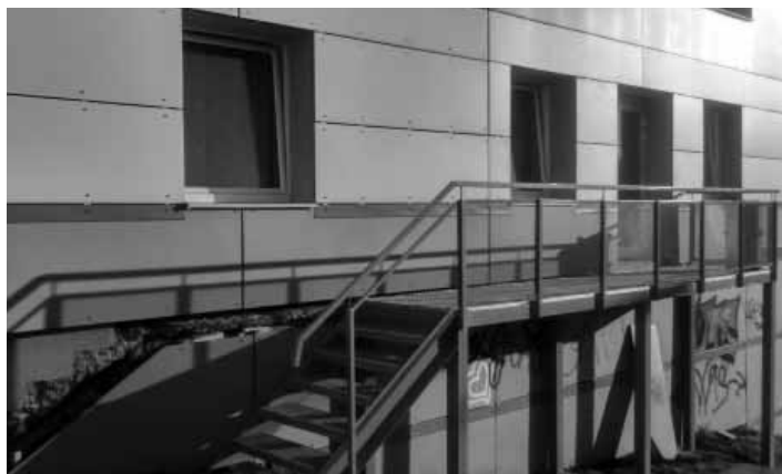
Vstup do nocľahárne v objekte plavárne

51.str. Príspevok za poskytnutú službu bude vo výške 0,50 €/noc, sprchovanie 0,10 €, pranie, sušenie 0,20 €. Vybierané poplatky budú použité na zabezpečenie čističích, pracích prostriedkov a na iné výdavky súvisiace s prevádzkou priestoru. Po ukončení všetkých rekonštrukčných prác bude priestor na prenocovanie zaregistrovaný v registri poskytovateľov sociálnych služieb na Úrade Banskobystrického samosprávneho kraja ako nocľaháreň, kde sa budú poskytovať služby v zmysle zákona č. 448/2008 Z.z. o sociálnych službách, čím sa vytvorí kompletné podmienky na zabezpečenie základných životných potrieb a zároveň sa napomôže riešeniu nepriaznivej sociálnej situácie ľudí bez domova, ktorí sa nebudú združo-