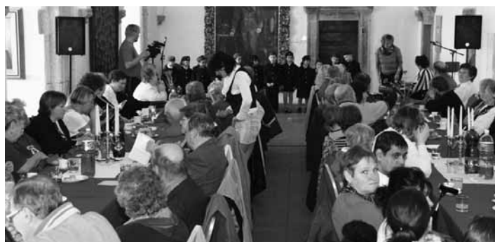
Stretnutie generácií na Starom zámku

cviku – pani Aleny Mlynárikovej, prezentovali formou prípravy stolovania a občerstvenia. Všetci prítomní sa dobre zabavili počas bohatého kultúrneho programu. Zabezpečili ho deti z Materskej školy na ulici 1. mája (členovia súboru Permoník), študenti Základnej školy Jozefa Horáka, študenti Gymnázia A. Kmeťa, členovia Živeny a Klubov seniorov z Banskej Štiavnice