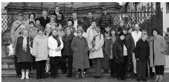
Stretnutie pred Morovým stĺpom

Technické problémy sa nám podarilo odstrániť ešte na generálnej skúške, takže všetko išlo ako po masle. Vystriedali sa rôzne umelecké žánre – tance, vážna i menej vážna poézia, klasické, no aj improvizované divadlo. Herci z tohto netradičného divadla sa prihovorili publiku už v úvodnej časti programu. Diva-