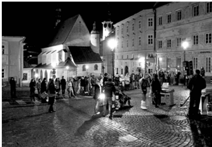
Sviečková slávnosť na 17.november

17.11. bol od 16:00 do 18:00 vyhradený deňom a premietať sa socialistické rozprávky v