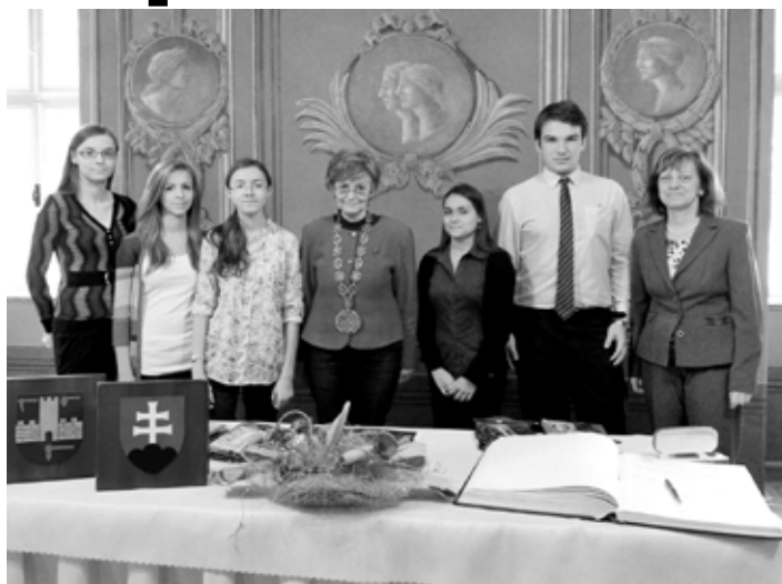
Prijatie študentov

V Obradnej sieni MsÚ si tak vypočuli slová vďaky a povzbudení do ďalšieho štúdia a života a prebrali vecné ocenenie študenti za vynikajúci prospech, reprezentáciu škôl a mesta, vynikajúce umiestnenia v olympiádach v cudzích jazykoch, prírodovedných olympiádach, ale aj medzinárodných drevorubačských pretekoch, barmanských súťažiach, za publikačnú a mimoškolskú činnosť, za angažovanosť v kultúrno-spoločenskom živote mesta, ako aj za záchranu ľudského života. Naozaj rôznorodé oblas-