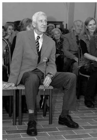
Členovia SZTP a ich hostia

Po oficiálnej časti nasledovalo malé spoločné posedenie