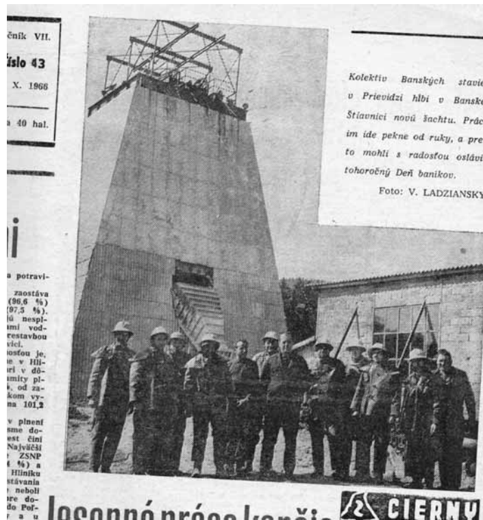
foto: Výstavba Novej šachty na stránkach Žiary socializmu

Propaganda mala za cieľ presvedčiť verejnosť, aké je baníctvo pre celú spoločnosť dôležité. Mala tiež náborový podtón a presviedčala ľudí o výhodách práce v bani. Vystavala obraz nového baníka, ktorý mal byť najmä v 50. rokoch v kontraste s baníkom starým. Nový baník mal študovať v dôstojných podmienkach. V médiách veľmi emocionálne opisovali uč-