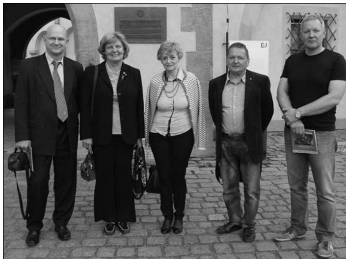
Účastníci konferencie v Kutnej Hore