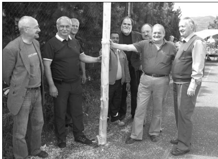
Stavanie mája na Drieňovej

Neodmysliteľne k tomuto podujatiu patrí tombola, ktorá ponúkala hodnotné ceny. Preto patrí veľká vďaka aj ďalším sponzorom, ktorými boli COOP Jednota - Žarnovica, reštaurácia Black M. Ozvučenie zabezpečila firma M+S z B. Štiavnice. Poďakovanie patrí záro-