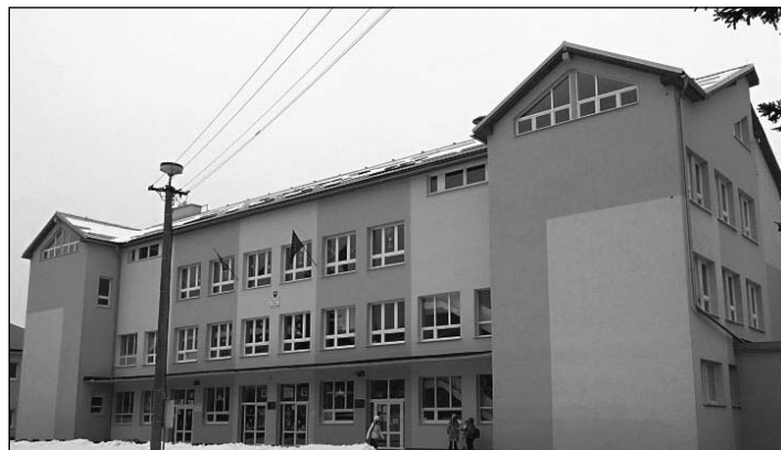
Budova ZŠ J. Horáka

• Kvalifikačné predpoklady: vysokoškolské vzdelanie druhého stupňa alebo vysokoškolské vzdelanie prvého stupňa alebo úplné stred-