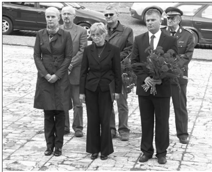
Položenie kytíc k Pomník padlých v Banskej Štiavnici