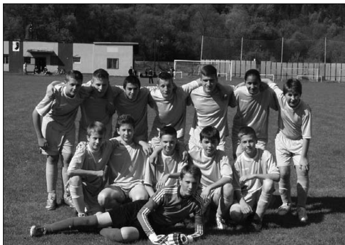
Futbalisti z II. ligy