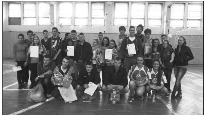
Účastníci volejbalového turnaja

V tento veľký deň sme zrealizovali náš Malý projekt pod názvom VOLEJBALOVÝ TURNAJ. Tento projekt bol spolufinancovaný Európskou úniou, Operačným programom vzdelávania Juventa a Komprax. Potrebné veci na realizáciu nášho projektu sme si zabezpečili dopredu. Potraviny na občerstvenie sme kúpili 14.4.2014 (pondelok). V tento deň sme si pripravili aj telocvičňu nášho školského internátu, ktorú sme dostali k dispozícii zadarmo. V tejto telocvični sa odohrával celý turnaj. Čo sa dalo urobiť dnes, tak sme spravili. Pomaly ale isto prišiel čas oddychu, spánku. V našom prípade bol spánok veľmi dôležitý hlavne preto, aby sme nabrali silu na zajtrajší deň „D“ ale aj preto, lebo sme skoro vstávali. Už ráno o 6.00 hod sme boli na nohách. Rozdelili sme sa na dve skupiny. Jedna skupina robila chlebičky a všeobecne pripravovala miestnosť s občerstvením. Druhá skupina zapájala reproduktory na spríjemnenie atmosféry turnaja, ktoré nám tiež poskytol internát zadarmo. Okrem toho robila aj posledné úpravy. O