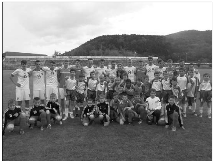
Účastníci Slovak cupu v Partizánskom

Neboli sme len divákmi. Počas prestávky medzi zápasom Slovensko - Ukrajina Česko - SAE odohrala naša prípravka exhibičný zápas proti mužstvu mladších žiakov usporiadateľského mesta. Pre všetkých je veľkým zážitkom osobne sa stretnúť so svojimi idolmi. A ktorí hráči sú najviac v kurze? Najviac sa v autobuse skloňovali mená Vestenický, Vencel, Hromada, Kadlec. Počas zápasu našej reprezentácie sme boli hlásateľom niekoľkokrát pochválený za vytvorenie pravej futbalovej atmosféry. Vyvrcholenie dňa prišlo, keď sa našej prípravke dostalo tej pocty vyvádzať hráčov Českej republiky na štadión a vzdať česť hymnám oboch mužstiev. Pevne verím, že fotky z tejto akcie budú vo vys-