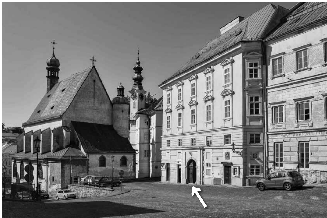
Rudné bane, š.p., sídli v Žemberovskom dome