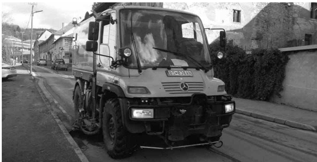
Čistiace vozidlo v uliciach mesta