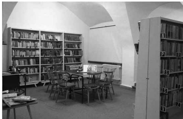
Knižničné priestory Rubigallu na 1. posch.

Hneď prvý marcový týždeň (28.2. – 4.3.) je Týždňom slovenských knižníc (TSK), ktorý odštartovaním intenzívnejších podujatí upozorňuje slovenskú verejnosť na prítomnosť a význam knižníc v našich životoch. Mestská knižnica v Banskej Štiavnici rovnako pripravuje niekoľko aktivít, ktorými chce postupne oživiť nielen svoje priestory, ale najmä vzťah ku knihe, čítaniu a knižnici ako priestoru pre kultúru, stretávanie sa, vymieňanie si čitateľských zážitkov, zdieľanie skúseností, vedomostí, pocitov a názorov. Knižnica je neutrálnou pôdou na takéto zdieľania a zároveň poskytovateľom a sprístupňovateľom písaného a tlačeného slova, ktoré v nezanedbateľnej miere dokáže ovplyvňovať naše životy. Tešíme sa na návštevy malých i veľkých, či už na informatických hodinkách pre deti a mládež, alebo na podujatiach, ktoré budeme postupne ponúkať. V najbližších