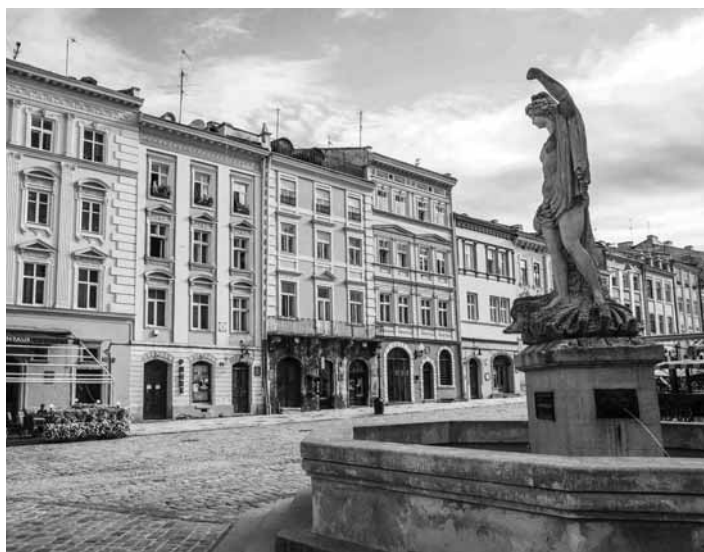
Ukrajinské mesto Lvov

Vláda SR vyhlásila od 26.2.2022, 12.00 mimoriadnu situáciu z dôvodu hromadného prílevu cudzincov na územie Slovenskej republiky, - vedenie Mesta Banská Štiavnica odsudzuje vojenskú agresiu voči Ukrajine a jej obyvateľom a pripája sa k tým, ktorí požadujú okamžité zastavenie vojnového konfliktu, - mesto Banská Štiavnica zároveň vyhlasuje verejnú zbierku nasledovných potrieb: deky, spacáky, hygienické potreby (vrátane plienok), obväzy, náplaste a iný drobný zdravotnícky materiál, voľne dostupné lieky proti bolesti, hnačke, vitamíny a pod.;