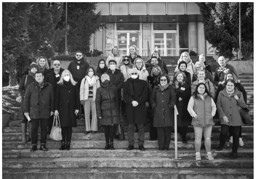
Účastníci stretnutia pred Súkromnou hotelovou akadémiou