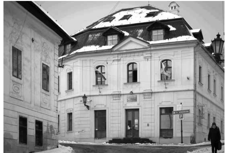
Sídlo SVP, š.p., v Banskej Štiavnici

Vzhľadom na tieto skutočnosti sa dlhodobo venujem tomu, aby som eliminoval všetky snahy o presídlenie tohto podniku z Banskej Štiavnice. Do r. 2021 novým sídlom podniku mala byť Banská Bystrica, od minulého roku čoraz viac naberali tendencie, ktoré sú už takmer realitou, aby generálne riaditeľstvo podniku malo svoje nové