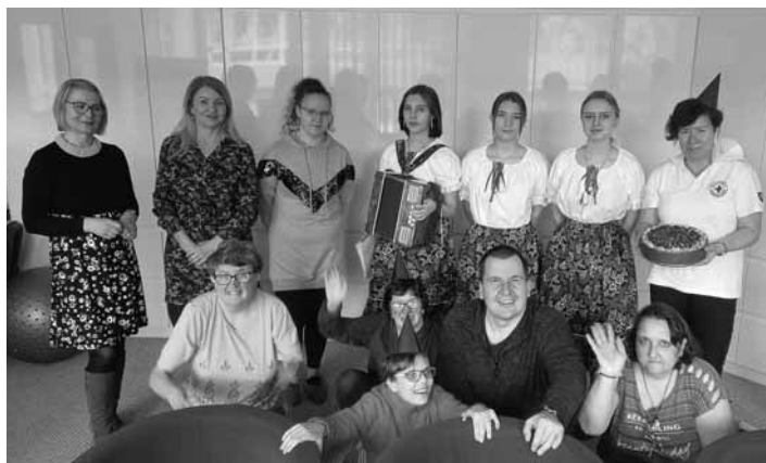
Program pre klientov DSS pri SČK

Klientom nášho DSS sa predstavili v krátkom programe, modernej i ľudovej piesni či v hre na heligónku. Zaspievali sme si spoločne, spoznávali sa navzájom a čo je naozaj potešujúce pre nás všetkých, naplánovali sme si i ďalšie spoločné aktivity.