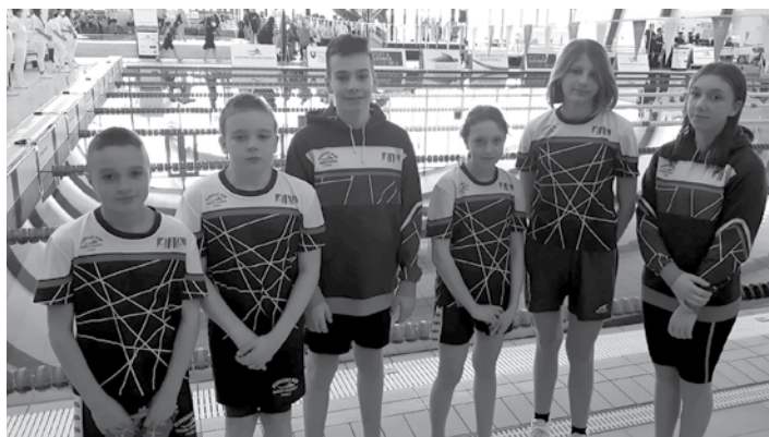
Plavci PK Banská Štiavnica

50m VZ 11. miesto, 100m VZ 20. miesto, 200m VZ 10. miesto, 400m VZ 9. miesto, 800m VZ 6. miesto, 100m P 22. miesto, 100m motýlik 8. miesto, 100m PP 17. miesto, Čamaj Ján: 50m VZ 7. miesto, 100m VZ 5.