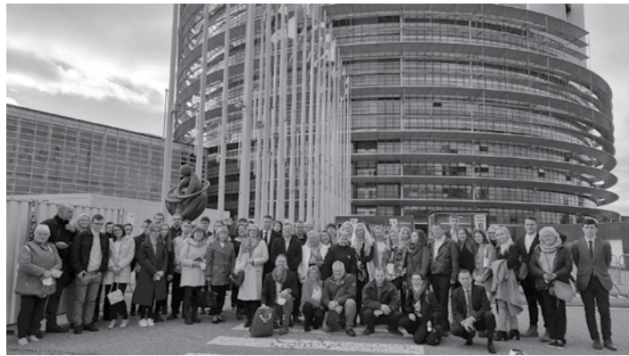
Delegácia pred Europarlamentom v Štrasburgu

Program počas celej návštevy bol naozaj pestrý a bohatý. Utorok 5. apríla začala cesta autobusom do Štrasburgu s príchodom do hotela v centre mesta o 22.00. V stredu 6. apríla po raňajkách v hoteli nasledoval spoločný presun do Európskeho parlamentu. Pred vstupom do EP prebehla akreditácia účastníkov. Následne po nej sme sa stretli s europoslancom Robertom Hajšlom, s ktorým sme mali možnosť diskutovať na aktuálne politicko-spoločenské témy. Po zvedavých otázkach hostí a zaujímavých fundovaných odpovediach pána europoslancu nasledovala prednáška o fungovaní Európskeho parlamentu v Návštevníckom oddelení EP. Po nej sme sa presunuli do návštevníckej galérie počas plenárneho zasadnutia a vypočuli sme si závery zo zasadnutia Európskej rady z 24. – 25. marca 2022 vrátane najnovšieho vývoja vojny na Ukrajine a sankcií EÚ voči Rusku a ich vykonávanie, Vyhlásenia Európskej rady, Rady a Komisie, na ktorom medzi inými vystúpil aj náš komisár, podpredseda Európskej rady pre Medziinštitucionálne vzťahy a strategický výhľad (2019-2024) Maroš Šefčovič. Nasledoval čas na spoločné fotografie a obed v parlamentnej jedálni pre návštevníkov. Poobede sme sa prinavrátili do centra mesta, kde individuálny program pokračoval prehliadkou katedrály No-