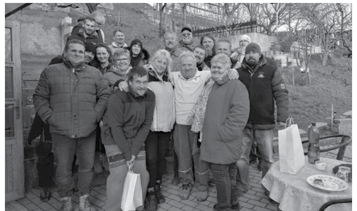
Záhradkári na záhrade