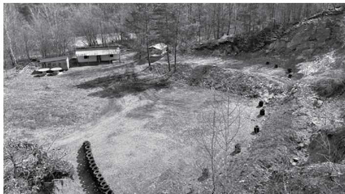
Areál strelnice

Slávnostné otvorenie prebehlo dňa 2.4.2022, ktorého sa zúčastnili starosta obce Banská Belá, členovia ŠSK BB a tiež hostia a obyvatelia obce Banská Belá. Aj keď nám počasie nepriala, tak účasť považujeme za skutočne hojnú a sme radi, že prišli aj malé deti. Pre všetkých bol pripravený program. Starší účastníci, ktorí mali viac ako 12 rokov si mohli vyskúšať streľbu z pištoľí a mladší účastníci zo vzduchoviek a airsoft zbraní. Záujem bol veľký, čo nás naozaj veľmi teší. Táto strelnica, ktorá slúži len pre klubové účely, to znamená že nemôže tam prísť ktokoľvek, ako napríklad do Tidly strelnice, vznikla v lome, kde bola aj predtým. Keď sa daný priestor preberal, bol v žalostnom stave – celé zarastené, veľký bordel po asociálnych spoluobčanoch, prebiehala tam nelegál-