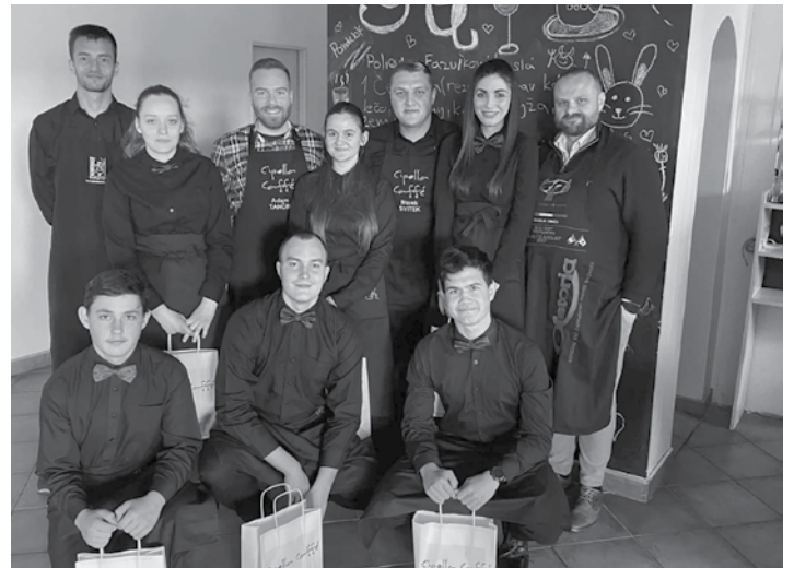
Víťazi baristickej súťaže