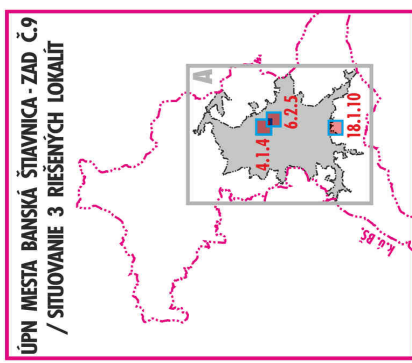
ÚPN MESTA BANSKÁ ŠTIAVNICA - ZAD Č.9 / SITUOVANIE 3 RIŠENÝCH LOKALIT'