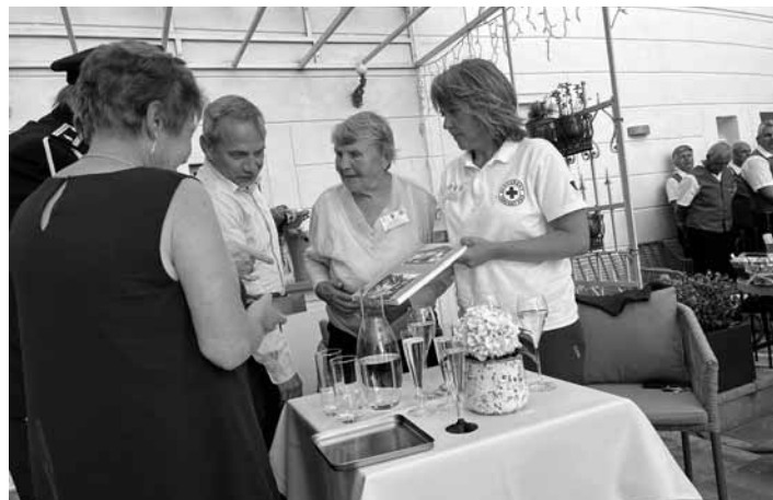
Uvedenie knihy do života