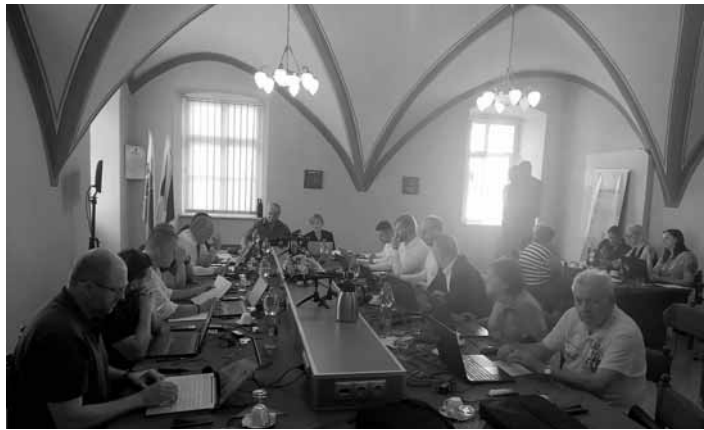
Rokovanie v zasadačke MsÚ

Komentár k jednotlivým rozpočtovým opatreniam: