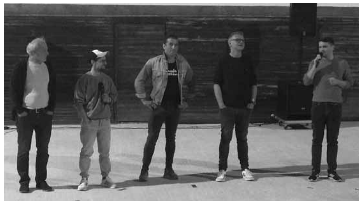
Tvorcovia nového filmu pred uvedením

Sprievodnými aktivitami festival rozšíril možnosti, akými svoju