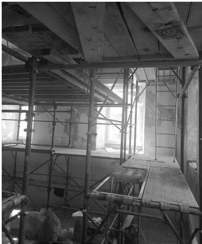
Lešenie v Kaplnke sv. Anny

Reštaurovanie malieb v kaplnke. Reštaurovanie kamenných prvkov, ktoré boli objavené v kaplnke. Zачistenie omietok s dodaním hmoty. Vyrovnanie nerovného povrchu stien. Odkryv (dočistenie nálezo- vých situácií na stenách miestnosti – stredoveká vrstva). Povrchové a hĺbkové upevnenie uvoľnených častí malieb a omietok. Vytmelenie poškodených častí – vrstiev malieb a omietok. Materiálová retuš poškodených miest omietok stropov miestnosti. Úprava škárov po škárování muriva uhladením. Omietky vápenné vnútorných ostení. Základné výtvarné scelenie a retuš malieb. Reštaurovanie torza točitého schodiska a gotickej pätky s nábehom lomených oblúkových rebier. Súčasne s prácami prebieha aj podrobné vypracovanie reštaurátorskej a fotografickej dokumentácie.