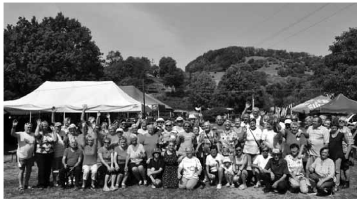
Seniari súťažili v disciplínach FOTO ARCHÍV ZO JDS ŠB

Tentokrát 19.8.2022 sme dostali pozvanie zo ZO JDS Kopanica a radi sme ho prijali, aby sme spolu zažili príjemný deň plný smiechu, pohody, radosti a zábavy. Niektorí sme tu boli prvýkrát, a tak sme boli prekvapení, aký krásny a upravený areál tu majú vybudovaný nielen pre seniorov, ale pre celé rodiny, chalupárov aj turistov. Súťažili sme v 6 disciplínach: petang, ruské kolký, hod na basketbalový kôš, šípky, kop na bránku, hod kruhmi na cieľ. Zapojili sme sa do všetkých disciplín, aj