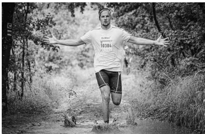
Beh lesmi v Štiavnických vrchoch