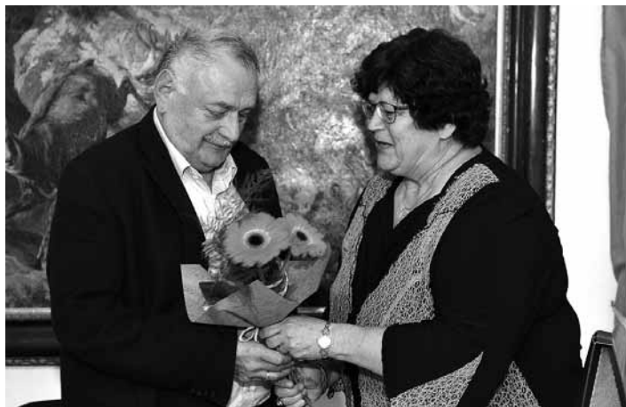
Blahoželanie k životnému jubileu