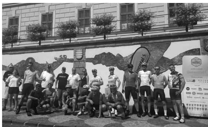
Cyklisti pred plastikami na Radničnom námestí

Minulý rok OSA- Športová akadémia, o.z., usporiadala nultý ročník športového cyklistického podujatia a tento rok ide oficiálne o 1. ročník, ktorý nadviazal na tento minulo-ročný pilotný projekt.