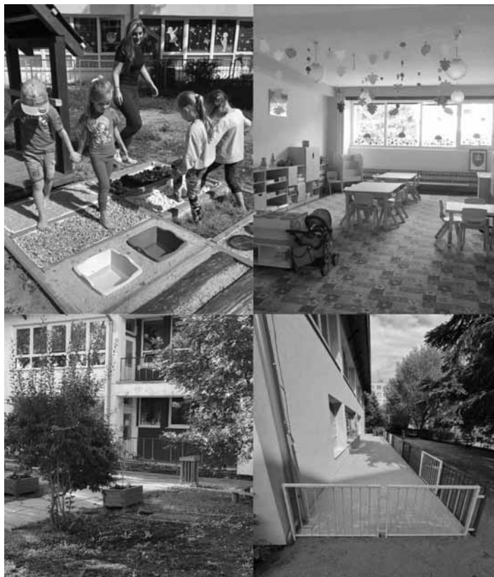
Obnova a modernizácia MŠ

Z projektu vyhláseného BBSK sme získali finančnú dotáciu vo výške 1200eur, z ktorej sme zakúpili lavičky, vyvýšené záhony, exteriérovú tabuľu, rastliny, zeminu a mulčovaciu kôru. Naším zámerom bolo vytvoriť estetické prostredie pri vstupe do budovy MŠ a zveľadiť priestor, ktorý je zároveň verejným priestranstvom, aby sa nielen deti, ale aj rodičia a iní návštevníci cítili u nás príjemne.