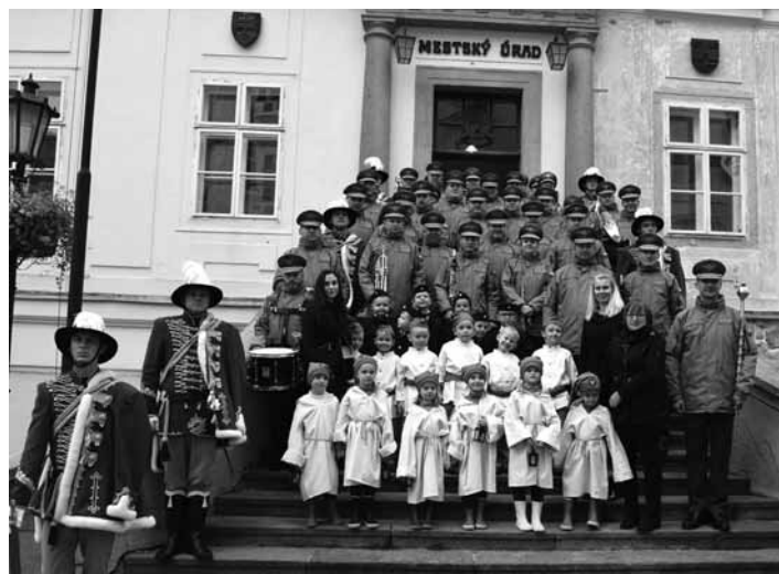
Deti z MŠ 1.mája s vojenskou dychovkou