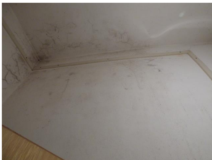
▲ Zatečený strop a stena v miestnosti pre upratovačku