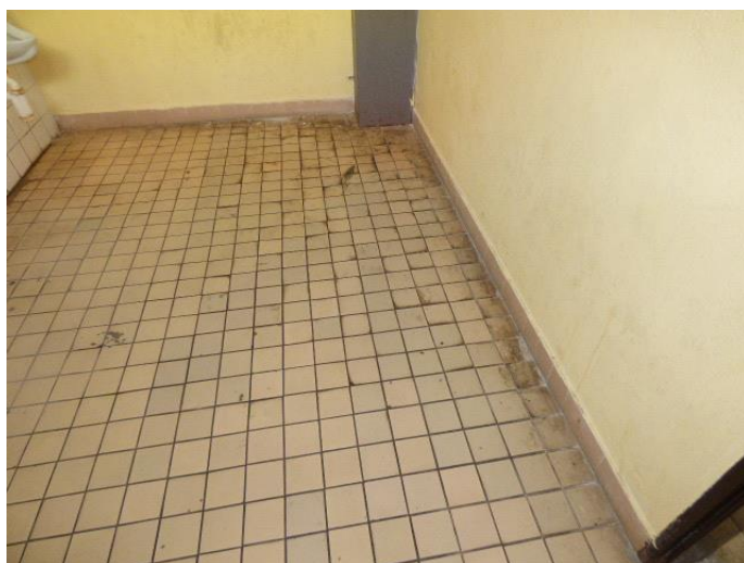
▲ Dlažba v miestnosti s pisoármi