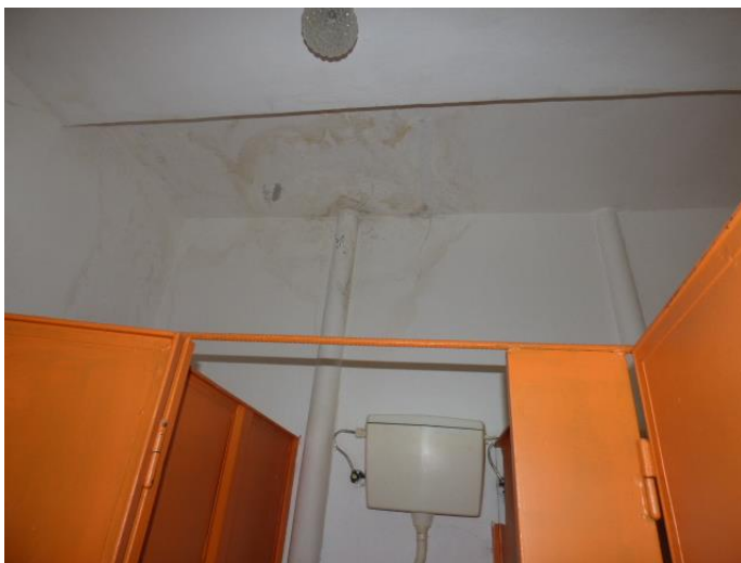
▲ Zatečenie stropu a steny v dievčenských toaletách