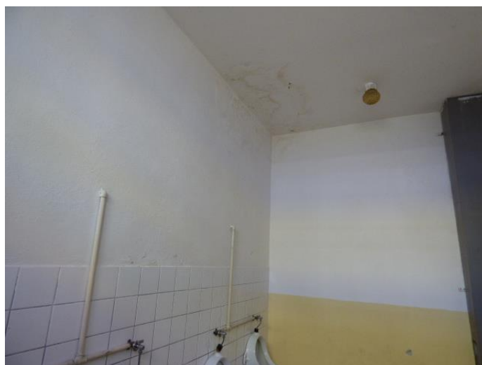
▲ Zatečený strop nad pisoármi