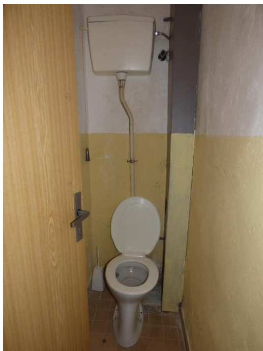
▲ Toaleta pre pedagógov