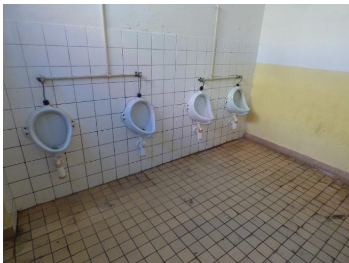
▲ Pisoáre, dlažba a obklad v chlapčenských toaletách