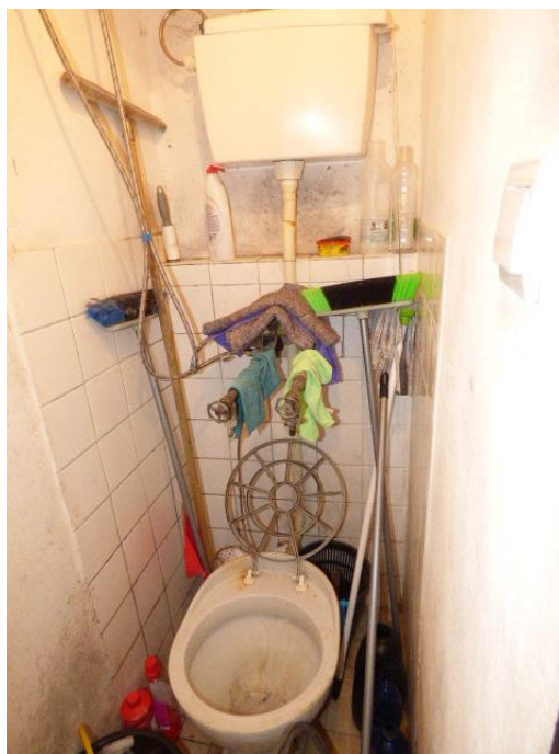
▲ Výlevka v miestnosti pre upratovačku