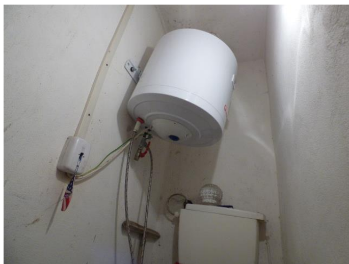
▲ Nový ohrievač TÚV v miestnosti pre upratovačku