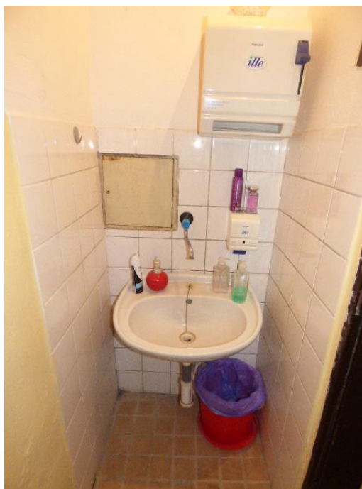
▲ Umývadlo v toalete pre pedagógov