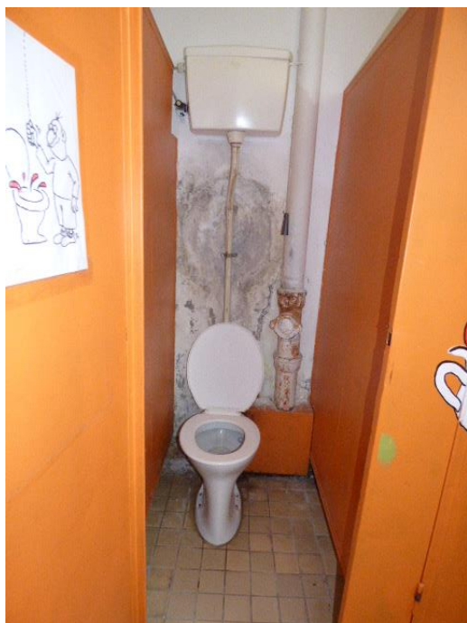
▲ Pleseň na stene v dievčenských toaletách