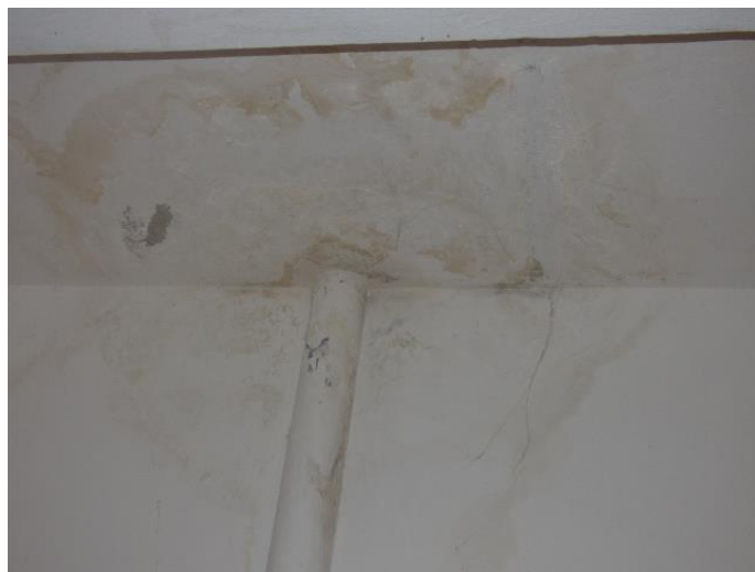
▲ Detail zatečenia