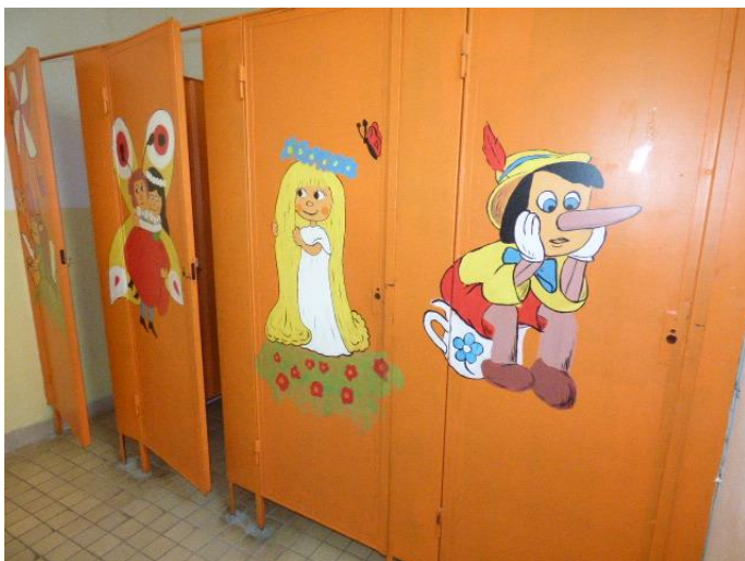
▲ WC boxy v dievčenských toaletách