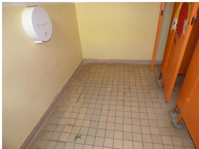
▲ Dlažba podlahy v dievčenských toaletách