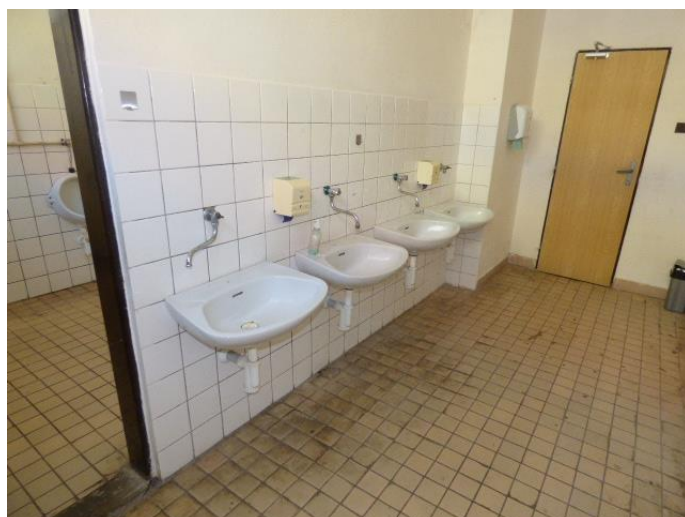
▲ Umývadlá v chlapčenských toaletách