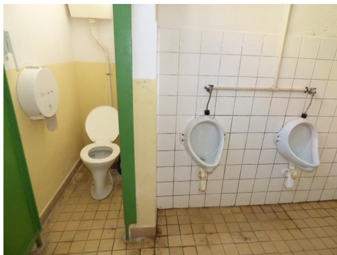
▲ WC misa v chlapčenských toaletách