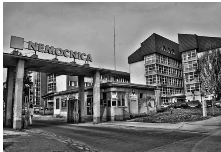
Nemocnica Žiar nad Hronom