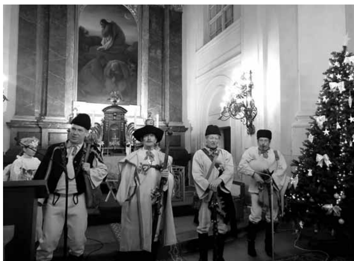
Folklorný súbor Sitňan v evanjelickom chráme