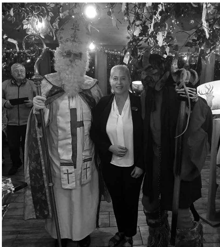
Mikuláš s čertom na Vindšachte