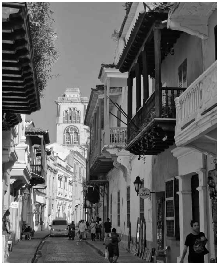
Historické ulice kolumbijskej Kartageny

Do Kolumbie som sa dostal v rámci expedície z Prírodovedeckej fakulty. Pozorovali sme rôzne ekosystémy vo vysokých horách, pobrežných močiaroch a mangrovoch. Tiež sme podnikli 4 dňový náročný pochod pohorím Sierra Nevada, kde ešte žijú