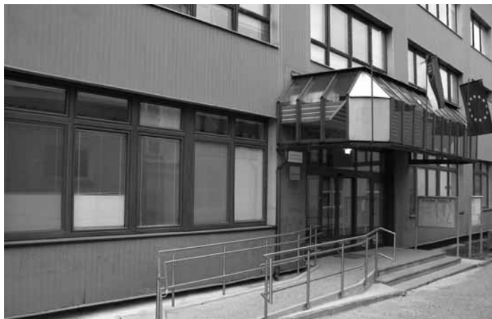
Sídlo OÚ v B. Štiavnici

V komunálnych voľbách pre volebné obdobie 2014 – 2018 som sa uchádzala o post poslankyne obecného zastupiteľstva a starostky obce Svätý Anton, ktorý je domovom našej rodiny od roku 2008. Po prejavení dôvery obyvateľov obce som tak nastúpila 12. decembra 2014 do funkcie starostky obce Svätý Anton. Pri výkone svojho mandátu som mala na zreteli zodpovednosť voči všetkým obyvateľom obce, čo sa prejavovalo pri každodennom plnení úloh a povinností. Pre zdravé fungovanie úradu som spolu s obecným zastupiteľstvom pri výkone právomocí od začiatku presadzovala opatrenia, ktoré posilnili otvorenosť a transparentnosť, ozdravili ekonomiku obecnej samosprávy a verím, že