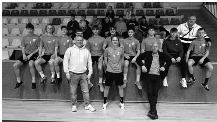
Zimná príprava dorastu

Cieľom bolo nabráť čo najväčšiu kondíciu a utužiť vzťahy medzi chlapcami. Počas 5 dní absolvovali