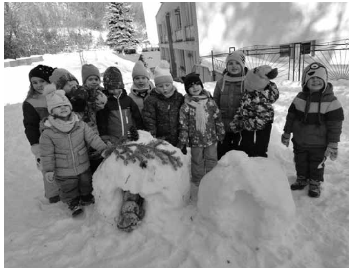
Ekodubáci z MŠ 1. mája