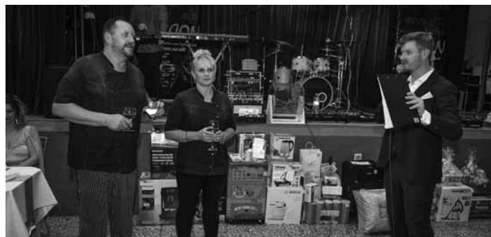
Otvorenie Jubilejného plesu FOTO LASKY

V sobotu 3.2. sa konal v obci Banská Belá už 5. jubilejný ples.