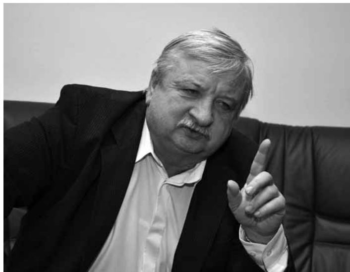
Jubilant prof. L. Miklós