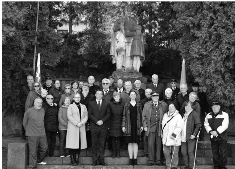
Účastníci spomienkových osláv