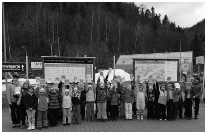
Žiaci ZŠ J. Horáka v Salamandra Resorte