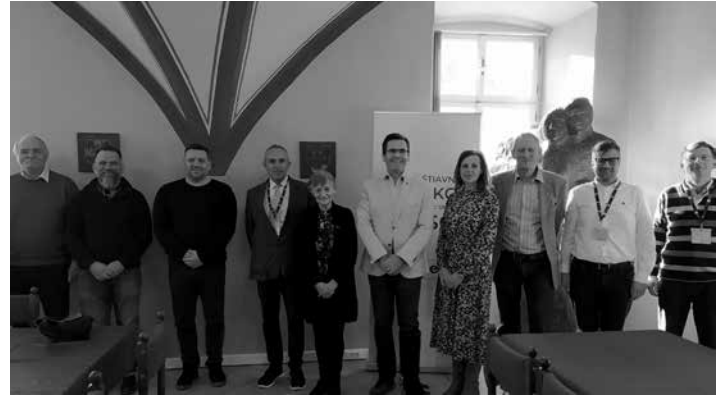
Delegácia v zasedačke MsÚ

práce, ktorú univerzita ponúkla mestu formou študentských prác v oblasti architektúry.