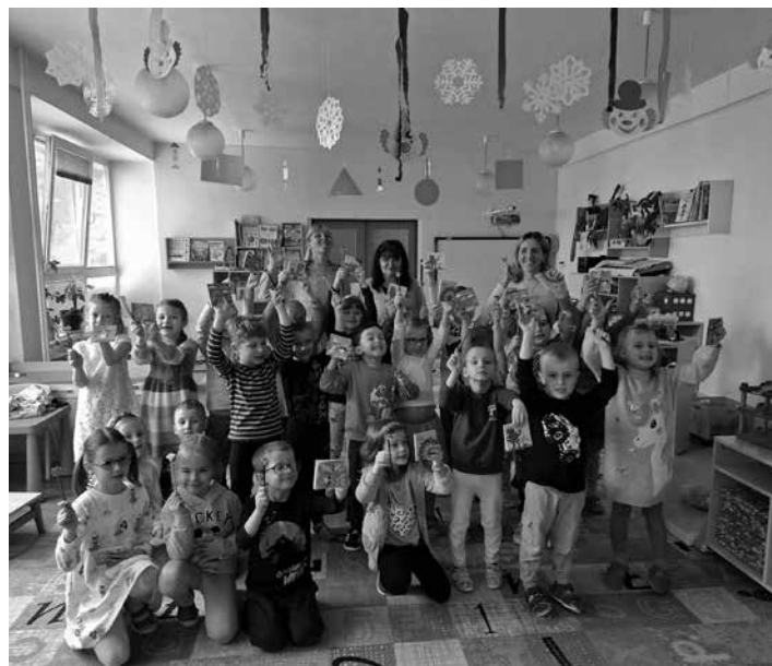
Deti z MŠ Bratská v DM BŠ

Okrem týchto akcií prebiehajúcich každý deň vo všetkých troch našich budovách Zariadenie sociálnych služieb Domov Márie pripravilo aj stretnutie s deťmi z materskej školy