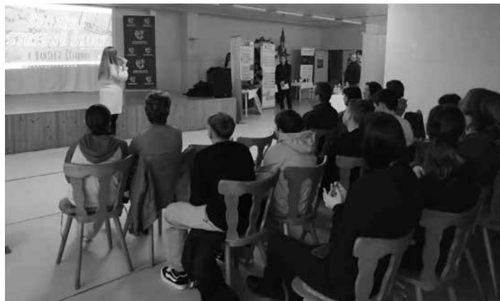
Prezentácia SŠ v BŠ

Podujatia sa zúčastnili žiaci základných škôl a ich rodičia. Počas podujatia bolo predstavených všetkých 6 stredných škôl pôsobiacich v meste Banská Štiavnica. Jednotliví zástupcovia stredných škôl v krátkosti odprezentovali svoju školu a vyzdvihli všetky be-