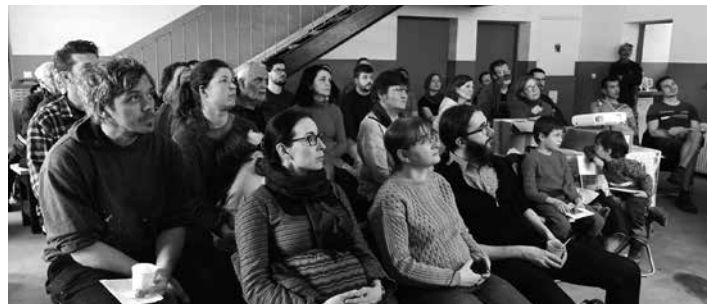
Premietanie a diskusia s odborníkmi

Na komentovanej terénnej prechádzke industriálnej štvrte v okolí Povrazníka, Hornej a Dolnej Huty či šachty František sme objavovali, mapovali, porovnávali existujúce i zaniknuté areály, objekty, stopy baníckej kultúrnej krajiny. Prechádzka vyúsťila do Šándorky – bývalej centrálny stupy (dnes sídlo spoločnosti Rekonbau). Priamo v historickej