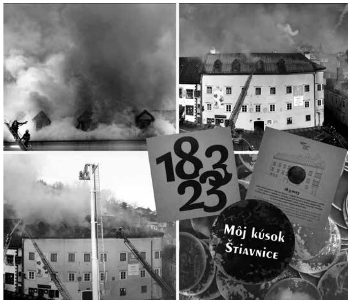
Medené medailóny

Zničená medená strecha, poznačená sadzou zo požiaru, bola premenená na 1 000 kusov unikátnych medailónov, ktoré teraz ponúkame verejnosti. Tieto medailóny v sebe