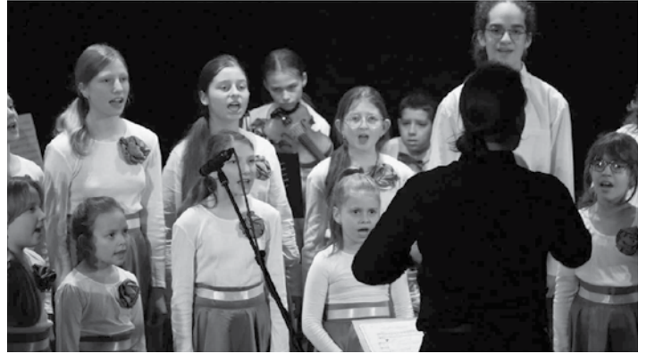
Koncert žiakov ZUŠ-ky

29.2. dopoludnia sa konal v ZUŠ seminár pre pedagógov ku pripravovanej klavírnej súťaži Banskoštiavnické kladivká o interpretácii slovenskej