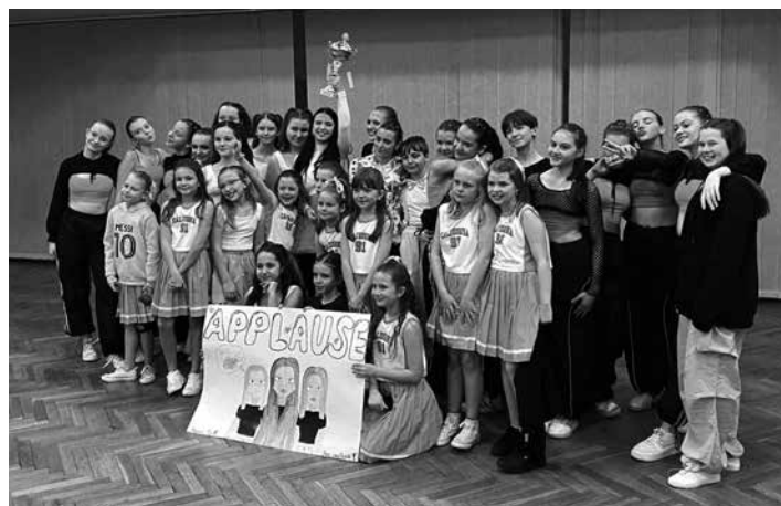
Tanečná skupina Applause

5.3. sa naše zlatička z tanečnej skupiny Applause zúčastnila okresného kola tanečnej súťaže Deň tanca v Žia-