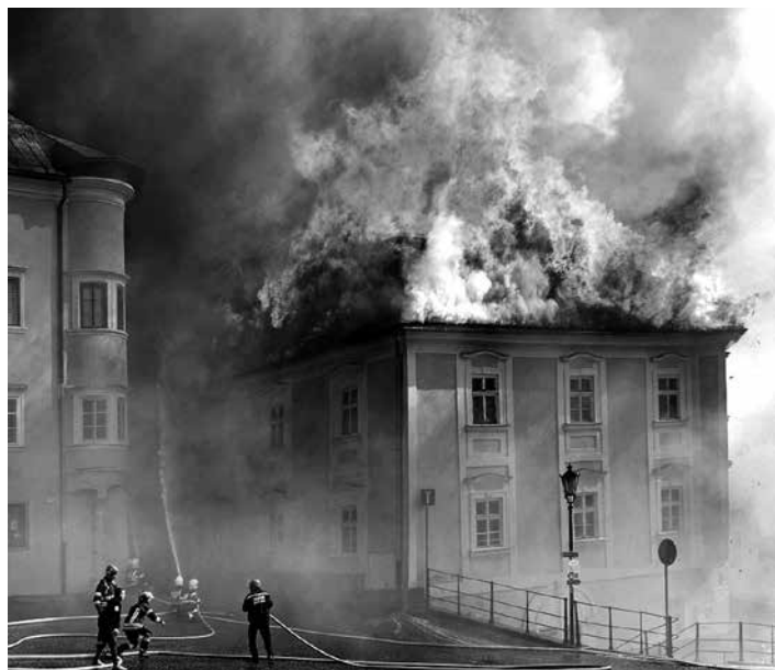
Ničivý požiar zasiahol aj budovu ZUŠ

Poškodených bolo sedem verejných a súkromných budov. Požiar v historickom centre Banskej Štiavnice vypukol v sobotu dopoludnia v jednej z historických budov, postupne sa rozšíril a poškodil sedem objektov – Fritzovský dom – Slovenský banský archív, Pischlov dom – Banka lásky, dom Maríny, Meštiansky dom –Nám. sv. Trojice 6/2- Pizzeria, Szitnyayovský dom – Základná umelecká škola; Námestie sv. Trojice 8/4, Bergergericht – Slovenské banské múzeum, Meštiansky dom – Dolná ružová 215/1, Meštiansky dom – kultúrne centrum Eleuzína. S výnimkou Eleuzíny ide o pamiatkovo chránené objekty, šesť národných kultúrnych pamiatok a jeden ďalší objekt v centre mesta, ktorý je zapísaný v zozname Svetového dedičstva UNESCO. Požiar sa rozšíril zo strechy meštianskeho domu na Námestí svätej Trojice, kde sa nachádza aj turistická atrakcia Banka lásky, na susedné budovy vrátane budovy základnej umeleckej školy, pizzerie a múzea Bergergericht. Pri zásahu bolo nasadených 30 profesionálnych hasičov a 80 vojakov. Okrem profesionálnych hasičov zasahovali aj dobrovoľní hasiči, Policajný zbor, dobrovoľníci, zamestnanci samosprávy, Slovenský Červený kríž, zamestnanci zasiahnutých budov. Oheň sa podarilo zastabilizovať až v popoludňajších hodinách. Likvidácia požiaru prebiehala do neskorých nočných hodín.