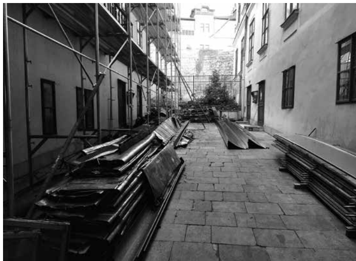
Staré a nové medené opláštenie strechy

Oheň a predovšetkým voda z hasenia zásadne zmenili ráz práce zamestnancov archívu, ktorí svoje úsilie v prvých mesiacoch po požiari zamerali na zistenie celkového roz-