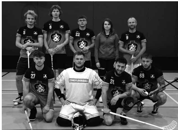
Florbalový tím Banská Štiavnica